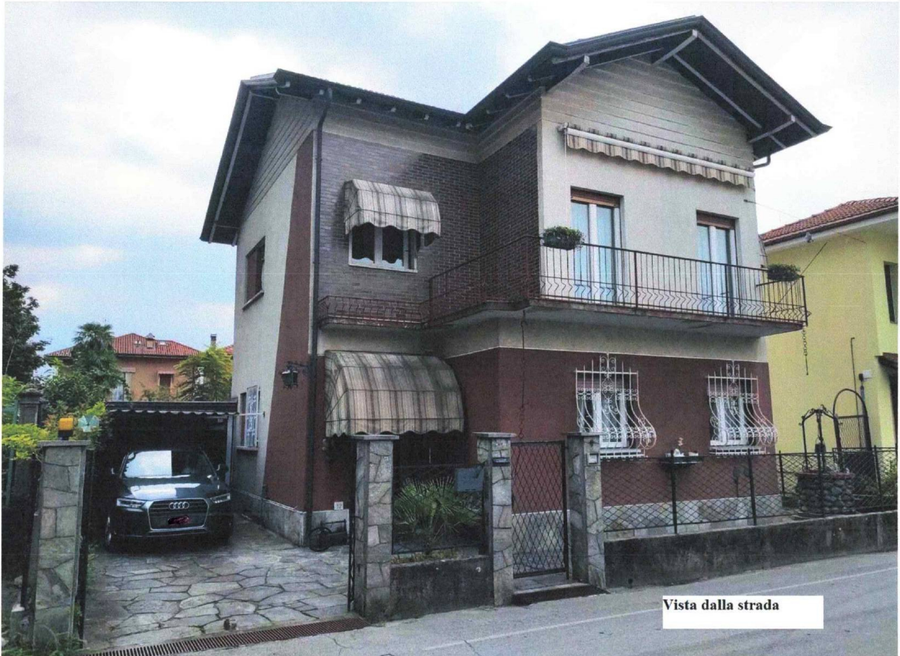
Vista dalla strada